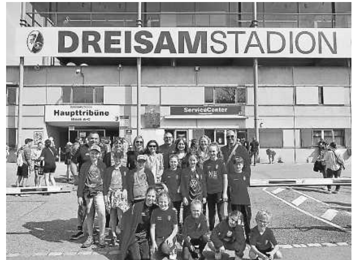
SCW u. Albschick in Freiburg

Die beiden Vereine streben weitere Aktionen für das Gemeinwohl in Wellendingen an und möchten sich weiterhin für die Kinder und Jugendlichen in Wellendingen engagieren.