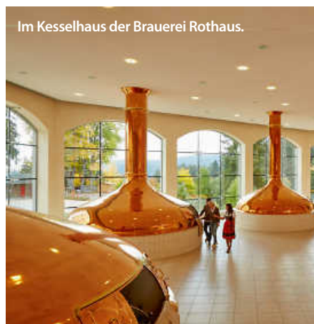
Im Kesselhaus der Brauerei Rothaus.

Also auch bei uns im Ländle. Mit einer Vielzahl an Brauereien, von historisch bis modern, bietet Baden-Württemberg vom klassischen Pils über traditionelle Klosterbieren bis hin zu ausgefallenen Craftbier-Kreationen eine Geschmacksvielfalt, die ihresgleichen sucht. Und der Tag des deutschen Bieres bietet Anlass für die Brauereien, diese zu zelebrieren. Ob auf Bierfesten oder bei speziellen Verkostungen – der Tag feiert das, was Baden-Württemberg in Sachen Bier so einzigartig macht.