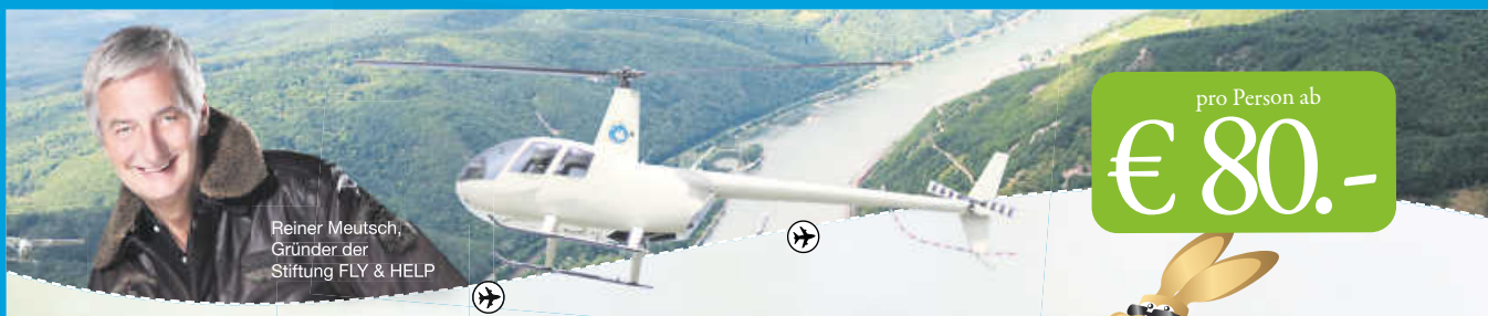
Reiner Meutsch, Gründer der Stiftung FLY & HELP