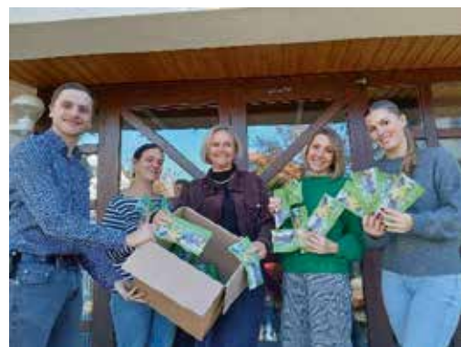
Kindergarten Gute-Beth Deißlingen