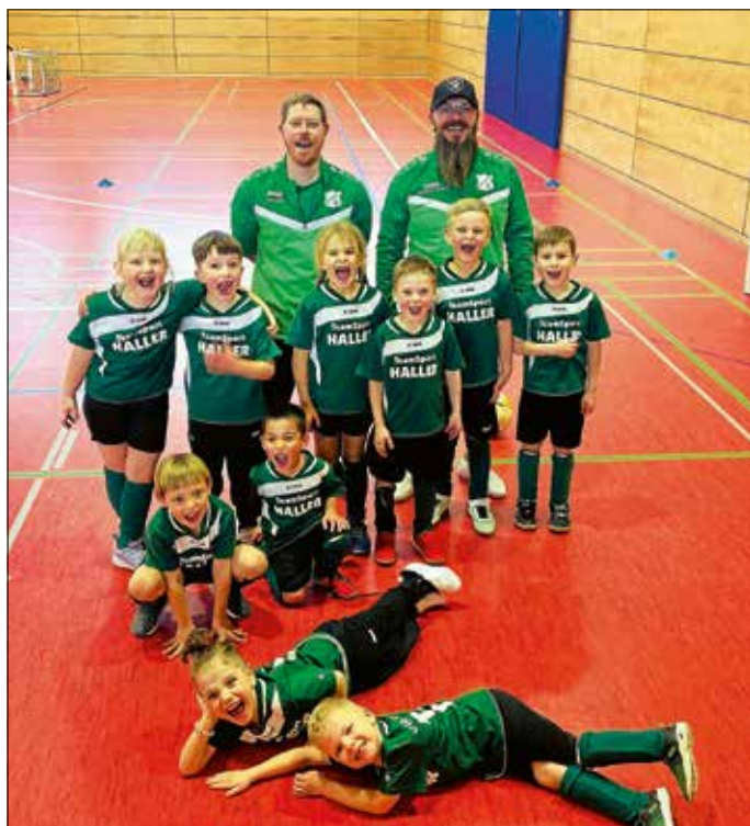
Die erfolgreiche Bambini-Mannschaft