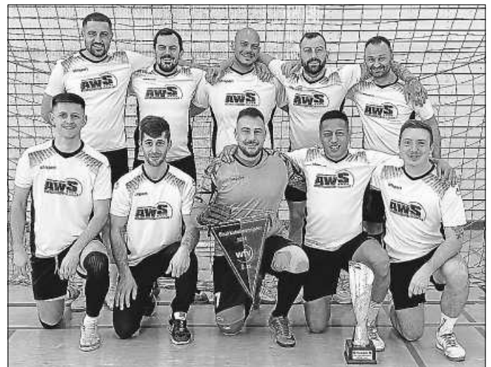
Die Ü32-Senioren des SCW

Herzlichen Glückwunsch zu diesem großen Erfolg.