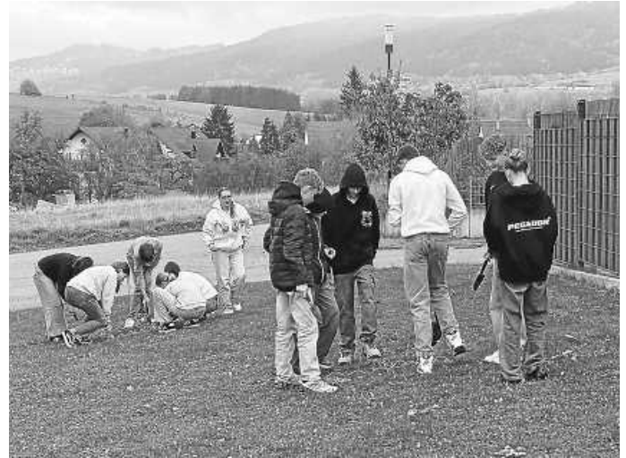
Konfirmanden aus Denkingen, Aldingen und Frittlingen