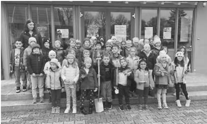
Gemeinschaftsaktion der Leintalschule (Klasse 1) + Leintalkinderhaus (Vorschüler) Frittlingen