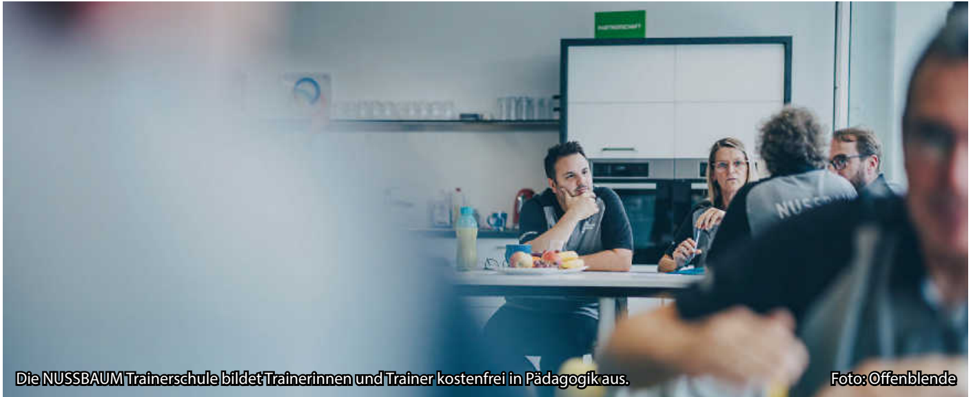
Die NUSSBAUM Trainerschule bildet Trainerinnen und Trainer kostenfrei in Pädagogik aus.

Die kostenfreie Trainer-Workshopreihe erstmals auch in der Region - jetzt bewerben