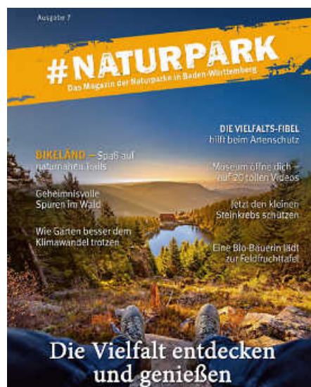
Das jährlich erscheinende Magazin #Naturpark beleuchtet nachhaltige Regionalentwicklung und kulturelles Erbe.

Rückkehr des Storchs im Naturpark Stromberg-Heuchelberg bieten besondere Einblicke. Mit den Blumen- und Genussworkshops im Naturpark Obere Donau oder den Veranstaltungen zum Limes-Jubiläum im Naturpark Schwäbisch-Fränkischer Wald sowie mit dem Bikeländ in Eberbach im Naturpark Neckartal-Odenwald liefert das Magazin Unternehmungstipps für Groß und Klein. In Sachen Genuss hat der Schwarzwald einiges zu bieten, wie man im Beitrag über das Videoprojekt der Naturpark-Wirte der beiden Schwarzwälder Naturparke erfährt. Einen Besuch wert sind auch stets die Naturpark-Zentren der sieben Naturparke – was man dort außer reiner Wissensvermittlung erleben kann, erfährt man ebenso auf vier der insgesamt 69 Seiten des Magazins. (pm/red)