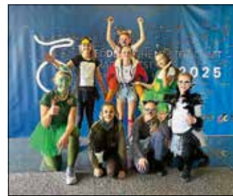
Kleingruppe Junior Expert