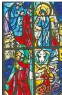
Ausschnitt vom Weihnachtsfenster

Ebenfalls möchte ich ein herzliches Vergelt's Gott aussprechen, an unsere