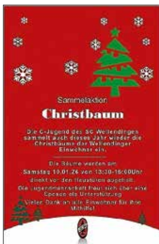
W. Minder Plakat: Verein

Über eine Spende für die Mannschaftskasse würden sich die jungen Kicker sehr freuen. Diese Spende kann direkt am Baum angebracht werden oder bei Abholung auch persönlich in eine Spendenkasse eingeworfen werden.