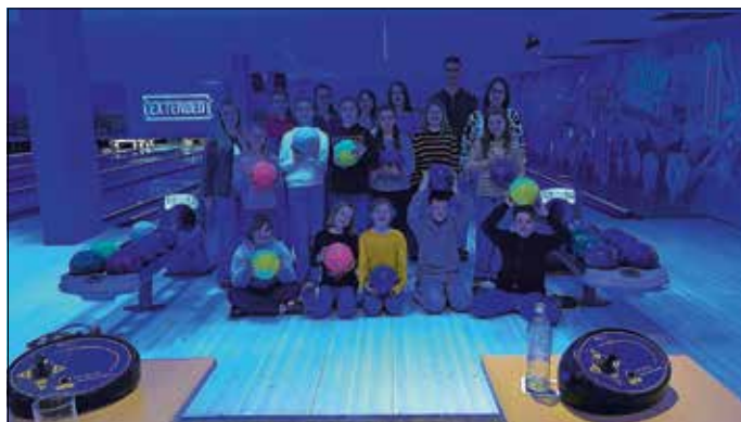
Jugendkapelle beim Bowlen

Am Sonntag, den 30. November, fand die diesjährige Weihnachtsfeier der Jugendkapelle der Musikvereine Wellendingen und Wilflingen statt.