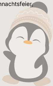
Plakat: Kinder- und Jugendbüro

22.12- 6.1.2025 Ferien Jugendhäuser geschlossen