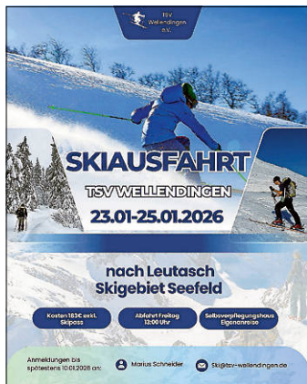
Plakat: TSV Wellendingen