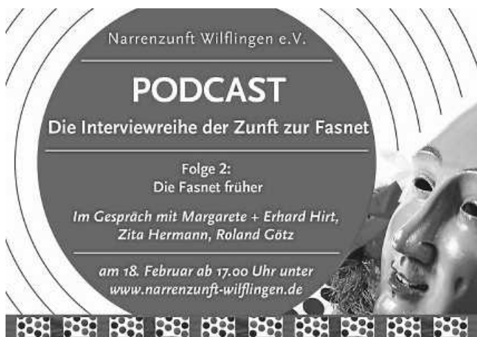
Folge 2 der Interviewreihe

Am Freitag, 18. Februar 2022 wird ab 17.00 Uhr die zweite Podcast-Folge mit dem Thema „Die Fasnet früher“ veröffentlicht.