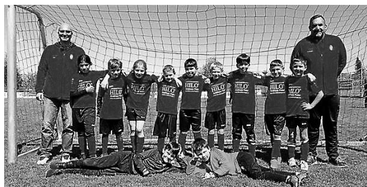
F-Jgd. in Seedorf

Unsere F-Jugend war am Samstag beim WFV-Spieltag in Seedorf im Einsatz.