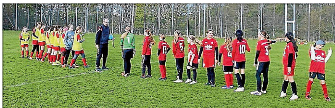
Spiel in Unterdisgisheim