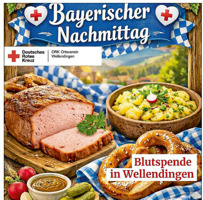
Einladung zur Blutspende Plakat: DRK OV Wellendingen