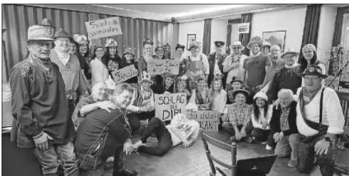
Die närrische Kappen-Kapelle

Wir freuen uns bereits jetzt auf unseren nächsten Kappenabend – schee war's!