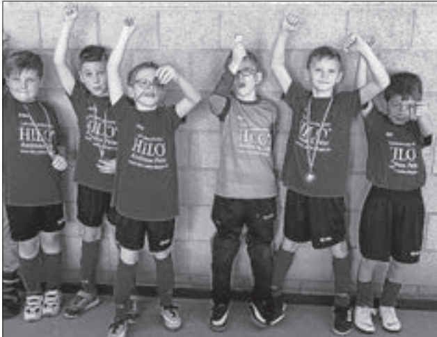
Unsere erfolgreiche F-Jugend in Frittlingen

E-Mail an den Vorstand: martin-haesler-scw@gmx.de Weitere Infos im Internet www.sc-wellendingen.jimdo.com Die Vorstandschaft