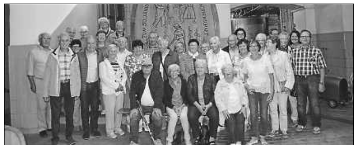
Kirchenchor Wellendingen mit Gästen im Weinkeller der Winzergenossenschaft Ihringen

Der Jahresausflug des Wellendinger Kirchenchors führte diesmal nach Freiburg und an den Kaiserstuhl nach Ihringen.