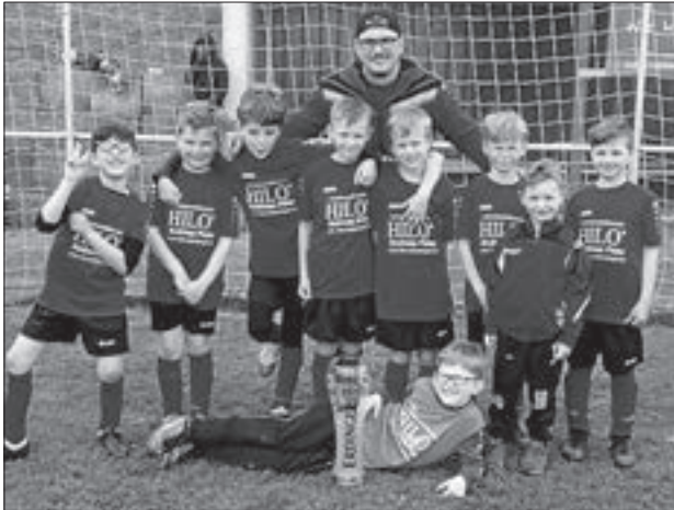
Unsere F-Junioren mit Trainer

Beim ersten Spieltag unserer F-Jugend in Wellendingen musste man sich mit dem FC Frittlingen, SV Zimmern 1, FV 08 Rottweil 2, SV Schörzingen und dem FV 08 Rottweil 1 messen. Als klarer Außenseiter konnte man gegen die starken Gegner aber mit sehr viel Kampf dagegen halten. So bekam man die Gegentore immer ziemlich gegen Schluss der Partien, da die Kräfte immer mehr schwanden. Gegen den SV Schörzingen konnte man aber doch noch mit 2:0 gewinnen. Trotz der restlichen Niederlagen können wir sehr stolz auf jeden einzelnen sein.