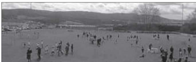
Eindruck vom den Bambini- u. F-Jgd.-Spieltagen in Wellendingen

Vielen Dank auch den Organisatoren und weiteren Helfern, welche zu einem reibungslosen Ablauf der Spieltage beigetragen haben.