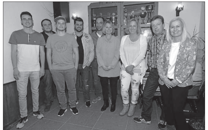
Der Ausschuss und die Vorstandschaft des Tennisvereins Wellendingen

Am vergangenen Freitag fand die 46. Generalversammlung des Tennisvereins statt.